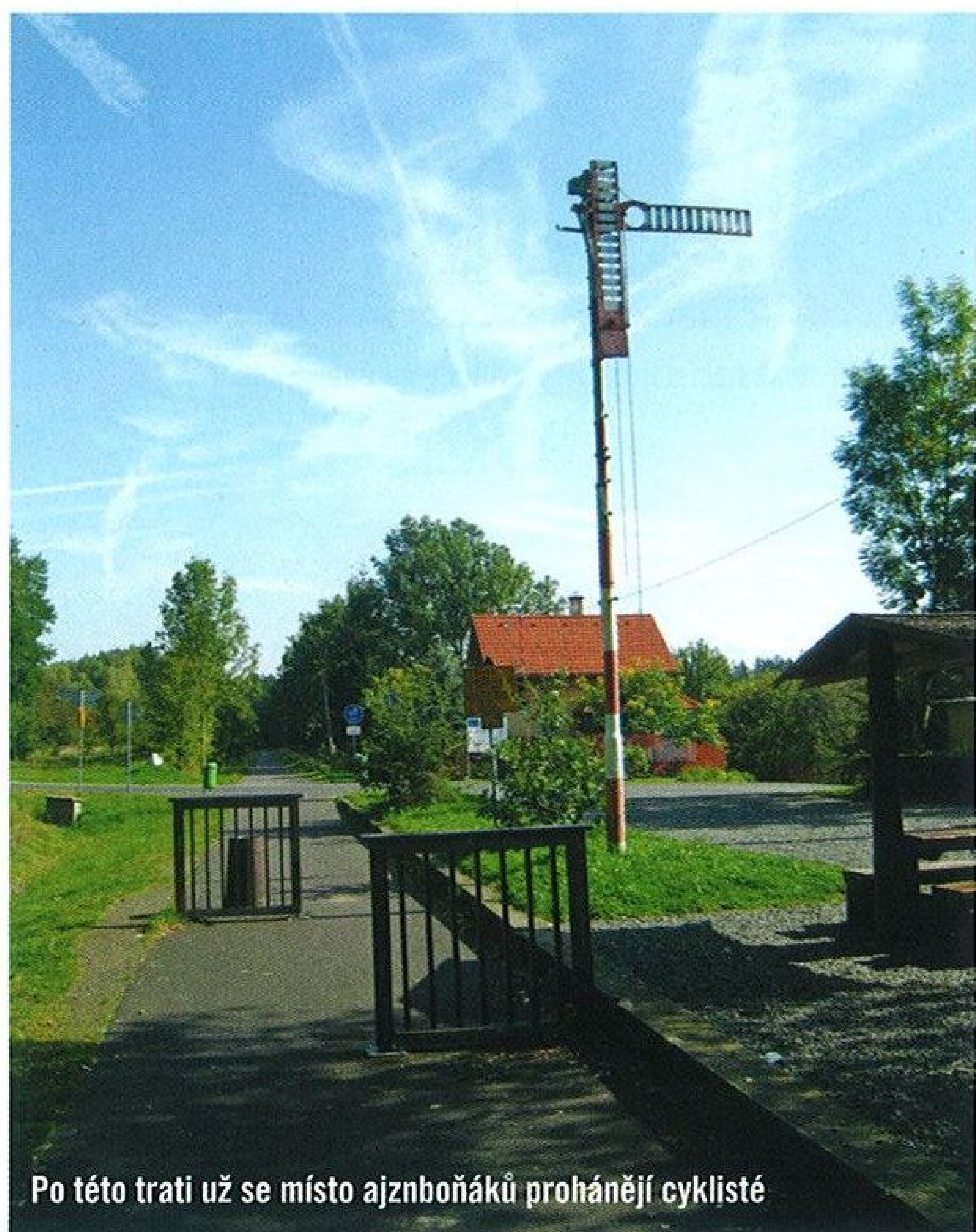
Po této trati už se místo ajzboňáků prohánějí cyklisté