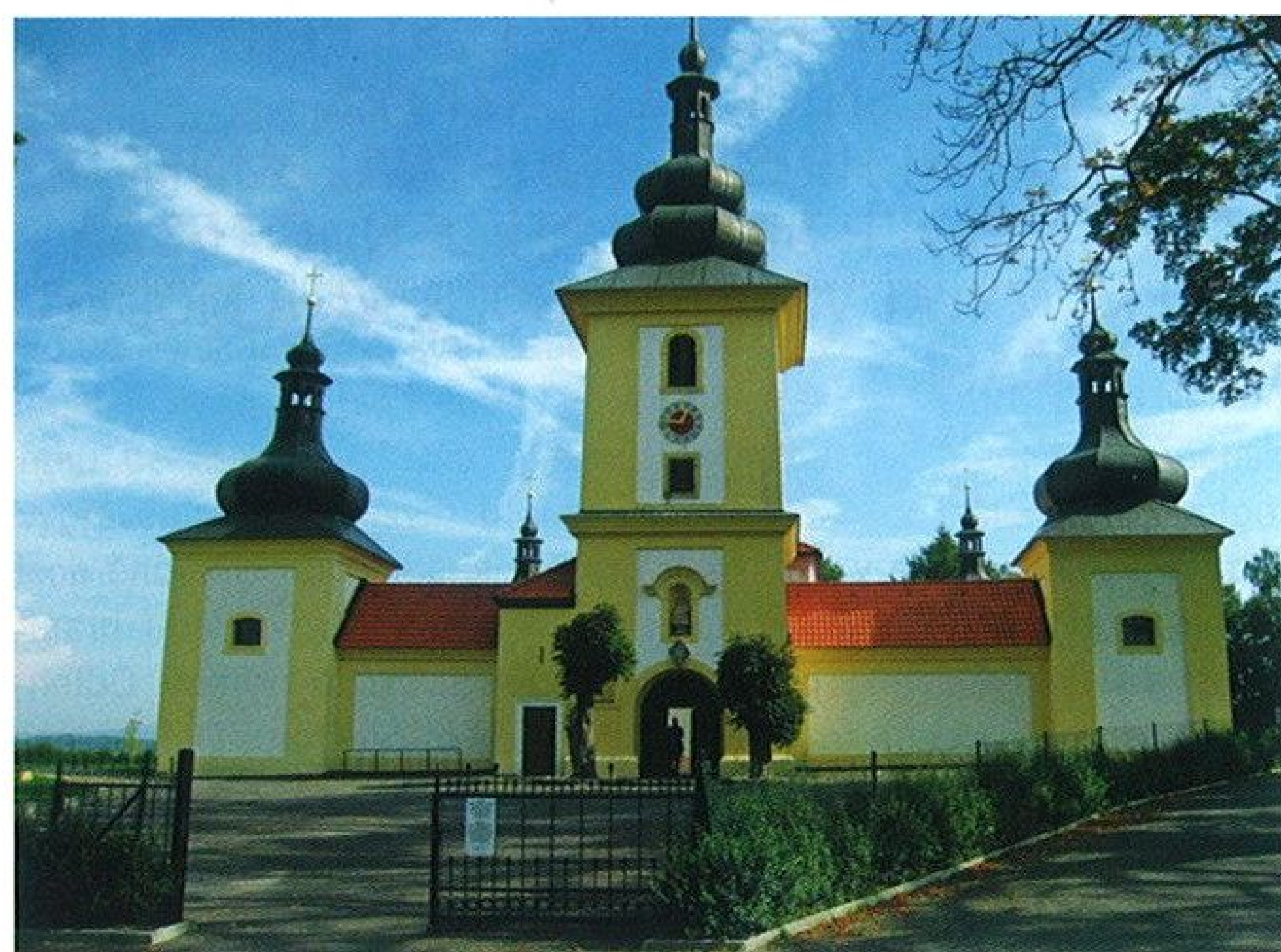
Loreta se skví opět ve své původní kráse