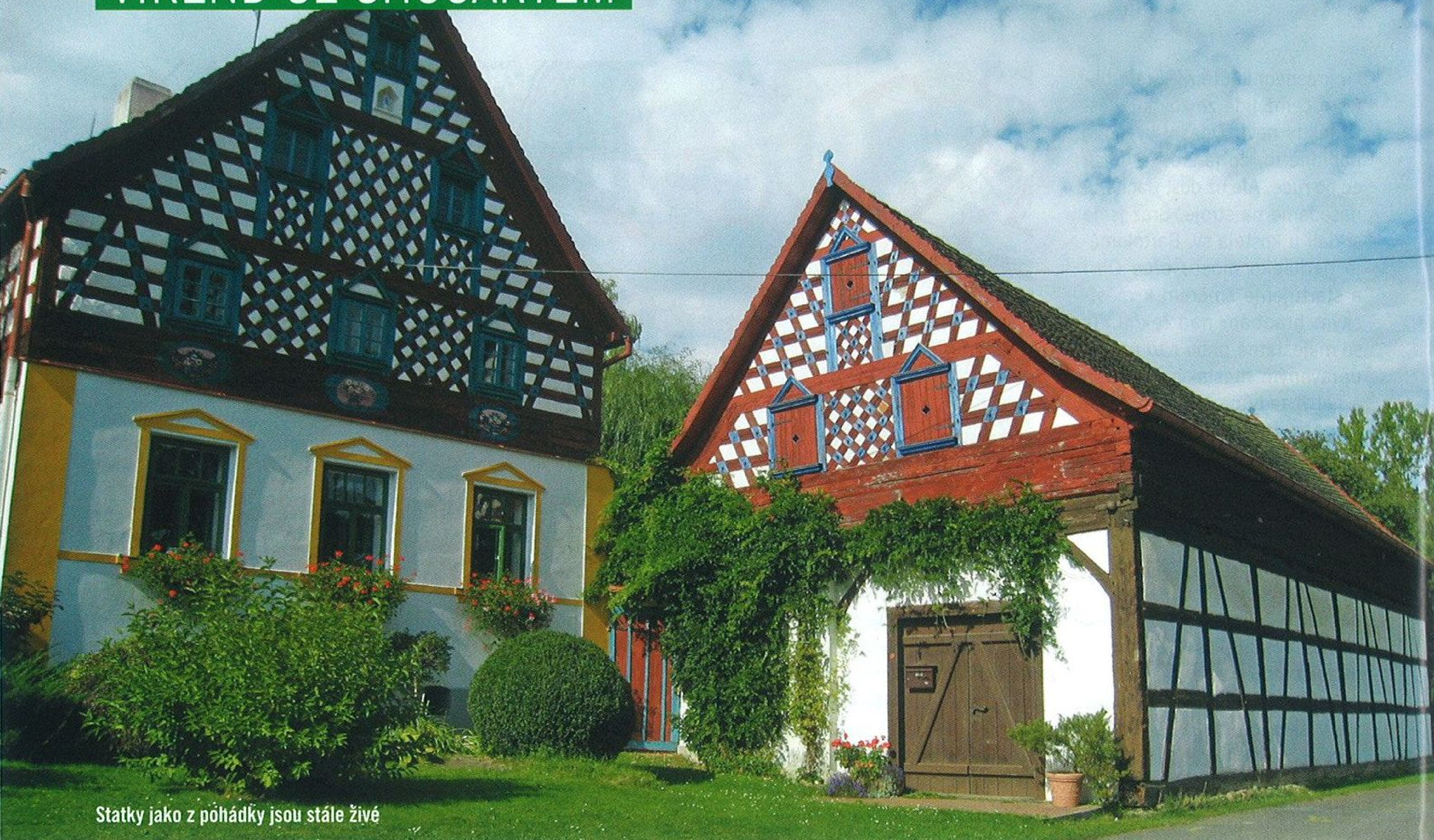
Statky jako z pohádky jsou stále živé