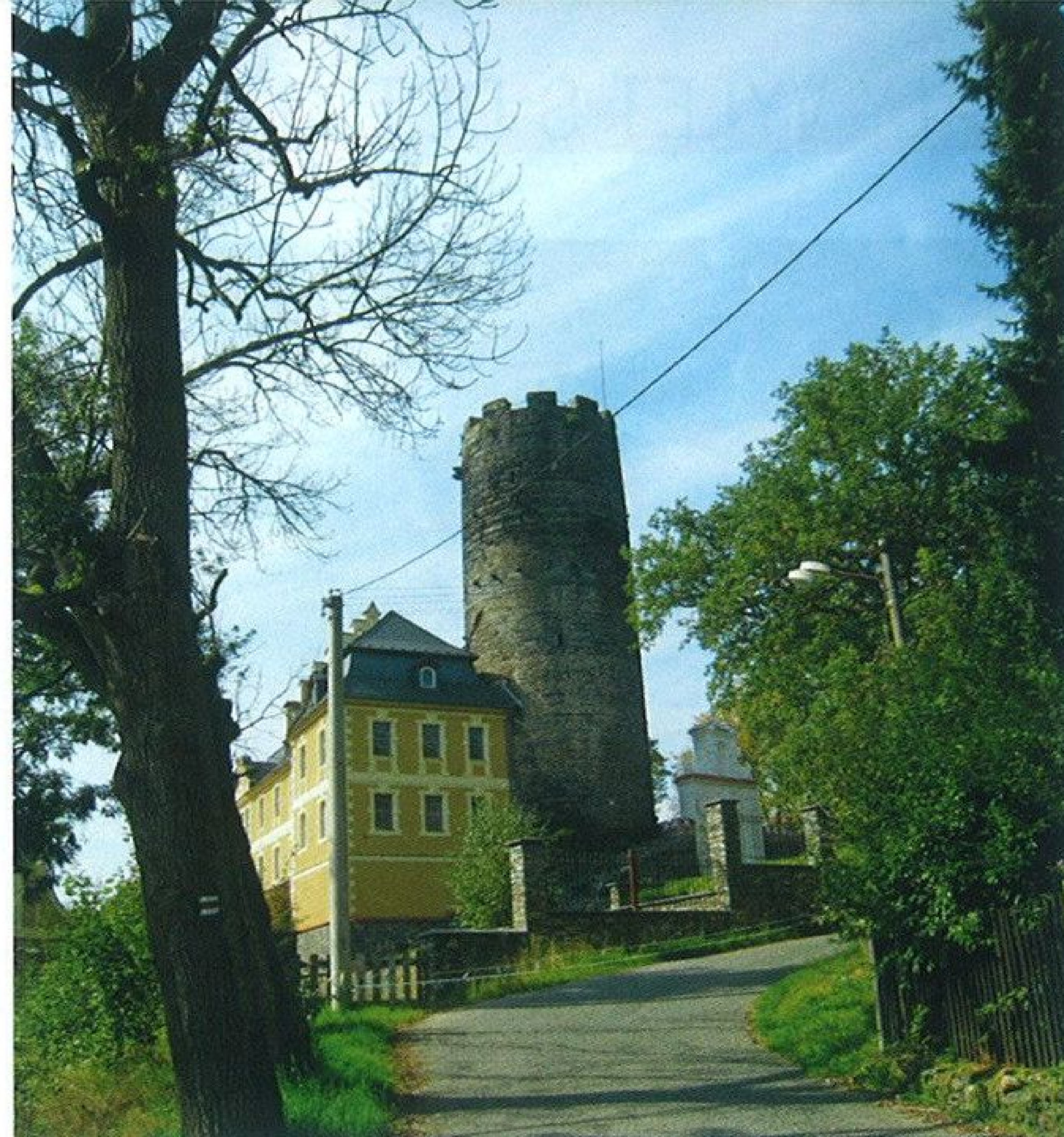
Věž v Hrozňatově je památkou na jeden z nejstarších hradů u nás

Z lesa vyjždíme u areálu Lorety. Její nová fasáda září již z dálky a nás ani nenapadne, že ještě před pár lety to byla ruina určená k demolici. Poutní místo zde bylo po staletí od dob, kdy tady chebští jezuité postavili křížovou cestu a kapli. V padesátých letech ovšem oblast uzavřelo zakázané pásmo a do opuštěného kostela se pustili vojáci a soudruzi pohraničníci. Roku 1989 přivítal svatostánek, zčásti vypálený, počmáraný sprostárnami a vykradený, první novodobé poutníky. Potřebné finance na záchranu poutního místa dodaly spolky starousedlíků z Německa, Češi zajišťovali opravu,